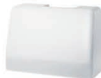
Kovček za prenos