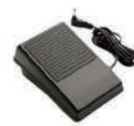
Stopalka za šivalni stroj